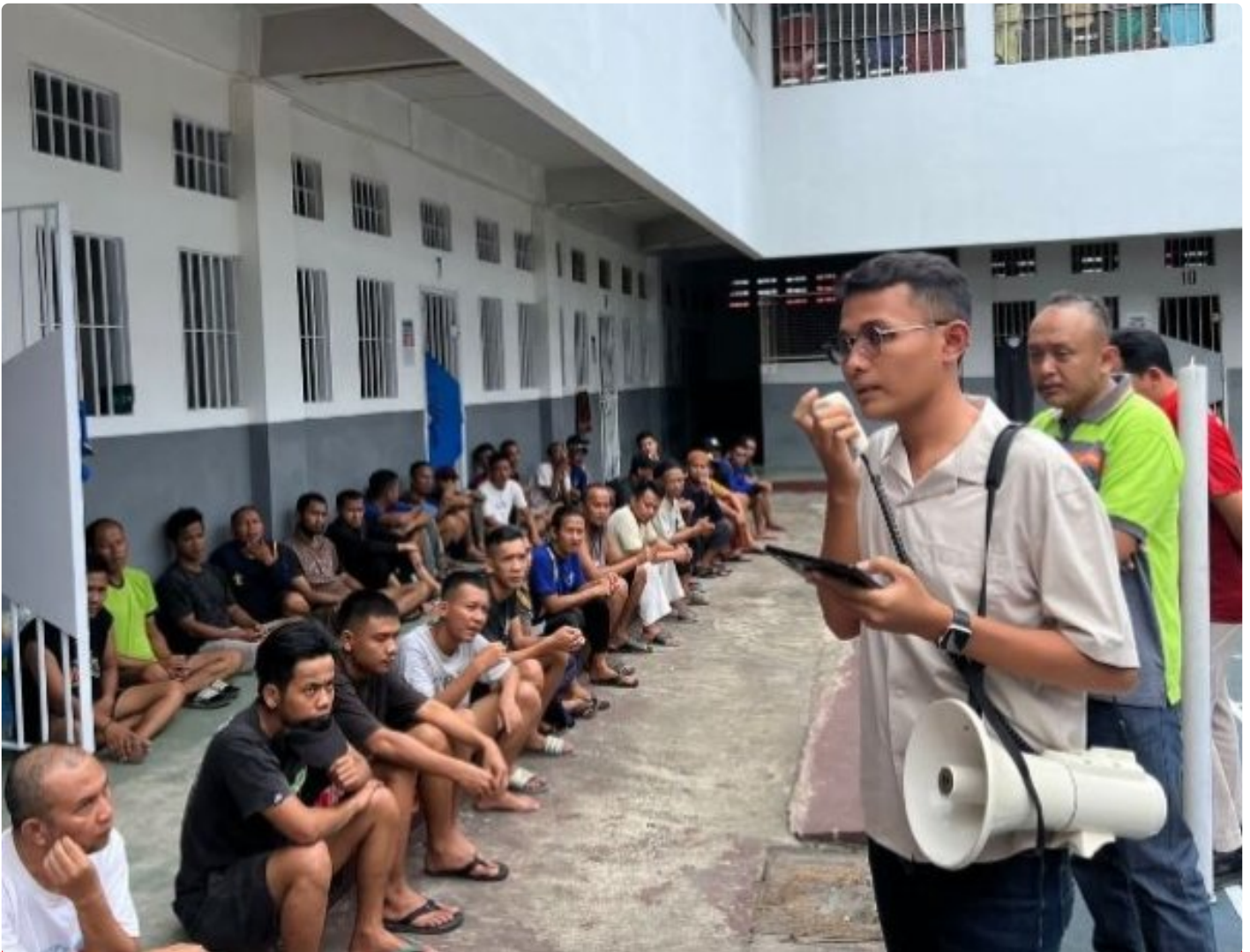
Lapas Purwokerto Sosialisasikan Hak dan Kewajiban bagi Warga Binaan

PURWOKERTO Lembaga Pemasyarakatan Kelas IIA Purwokerto menggelar kegiatan sosialisasi mengenai hak dan kewajiban warga binaan pemasyarakatan, dengan menekankan bahwa segala bentuk pengusulan pembebasan bersyarat dan program integrasi lainnya, dilakukan tanpa dipungut biaya, pada Sabtu (19/10/2024).